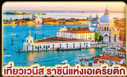
เที่ยวเวนิส ราชนิแห่งเอเดรียติก