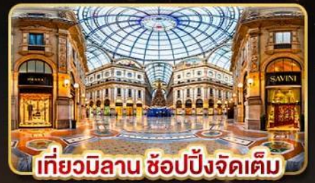
เที่ยวมิลาน ช้อปปิ้งจัดเต็ม