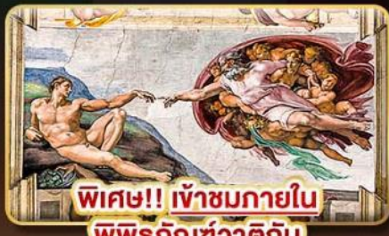
พิเศษ!! เข้าชมภายใน พิพิธภัณฑ์วาติกัน

เยือนประเทศต้นกำเนิด แห่งอารยธรรมยุโรป “อิตาลี”