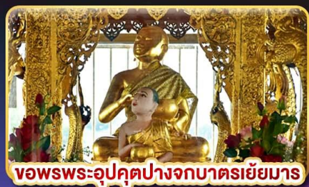
ขอพรพระอุปคุตปางจากบาตรเขี้ยว