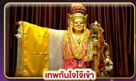
เทพทันใจโจ้เข้า