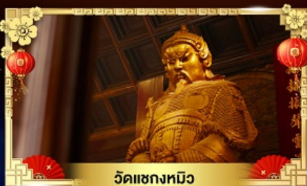
วัดแซกทมิว

หมูนกั้งหันนำโชควัดแซก สวนสนุกดิสนีย์แลนด์เต็มวัน