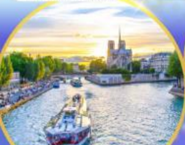
ล่องเรือแม่น้ำเซน