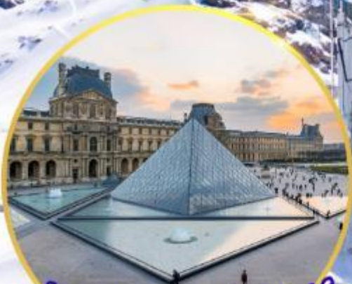
ถ่ายรูปพิพิธภัณฑ์ลูฟร์ GO3CDG-EK056