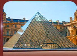
เซ็งอินพิพริกทินท์ลูฟวร์ ปารีส