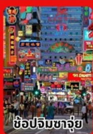
ช้อปปิ้งจุกจุก