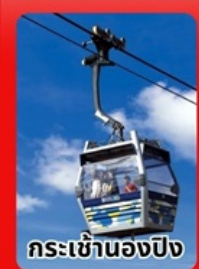
กระเช้าฮ่องกง