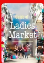
Guide of Ladies Market 女人街