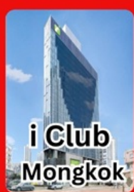
i Club Mongkok

คอนเฟิร์มเดินทาง พ.ย.67 1-3 / 8-10 / 15-17 / 22-24