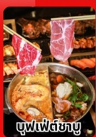
บุฟเฟ่ต์ชาบู