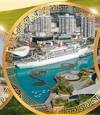
ท่าเรือ Sea World