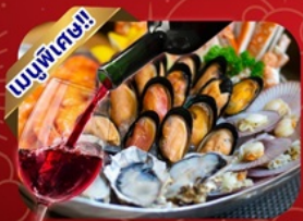
ซีฟู้ด-โฮ้น้แดง