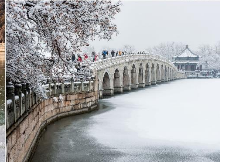
พระราชวังฤดูร้อนอวิ๋เหอหยวน