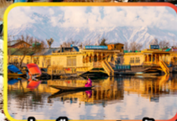
ล่องเรือทะเลสาบคิล