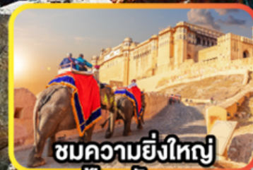
ชมความยิ่งใหญ่ ป้อมอัครา