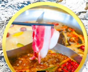
เมนูพิเศษ! สุกี้หม่าล่าเสฉวน