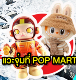
แวะจุ่มที่ POP MART