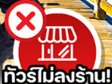
✗ ทีวีไม่ลงร้าน!