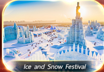
Ice and Snow Festival