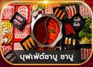
บุฟเฟ่ต์ซาบู ซาบู