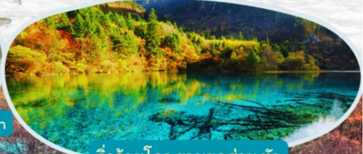
จิวจ้ายโกว รวมรถส่วนตัว