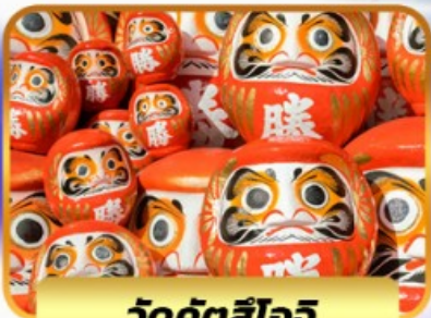
วัดคัตสึโงะ