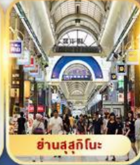
ย่านสุสึกินะ