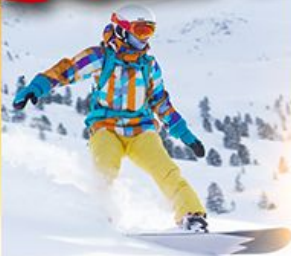
ลานสกีชิโกไซ