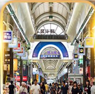
ย่านすすกิโนะ