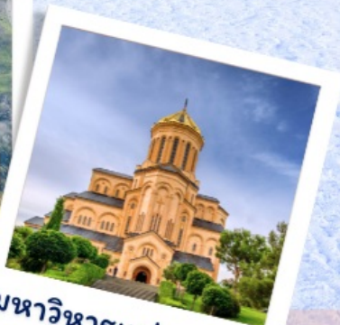
มหาวิหารแห่งทบิลีซี