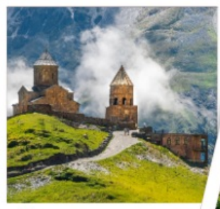
โบสถ์เกอร์เกติ