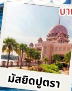
มัสยิดบุตรา