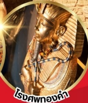
โรงศพทองคำ

บินภายใน 2 เที่ยวบิน จาก CAI - ASW // LXR - CAI