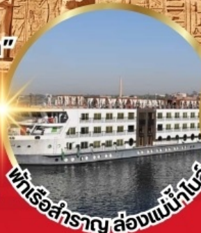
แพ็คเกจเรือสำราญ ล่องแม่น้ำไนล์

*เงื่อนไขเป็นไปตามที่บริษัทกำหนดเท่านั้น*