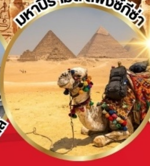
มหาปิรามิด สฟิงซ์กีซ่า