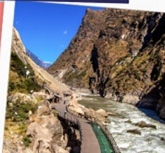
ช่องแคบเสือกระโจน รวมบันไดเลื่อน ขึ้น-ลง