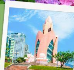
อาคารตอกบัว