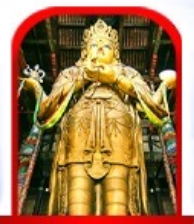
วัดกานดา