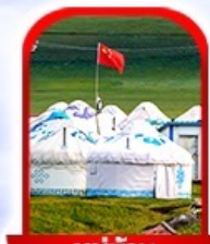
หมู่บ้าน พื้นเมือง