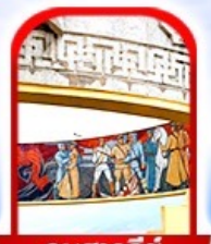
อนุสาวรีย์ โซซาน