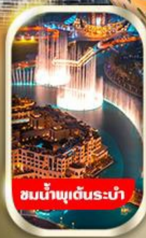
ชมน้ำพุเต้นระบำ

นั่งรถ 4WD ชมทะเลทรายอาหาร พร้อมทานดินเนอร์อาราเบีย