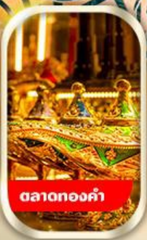
ตลาดทองคำ