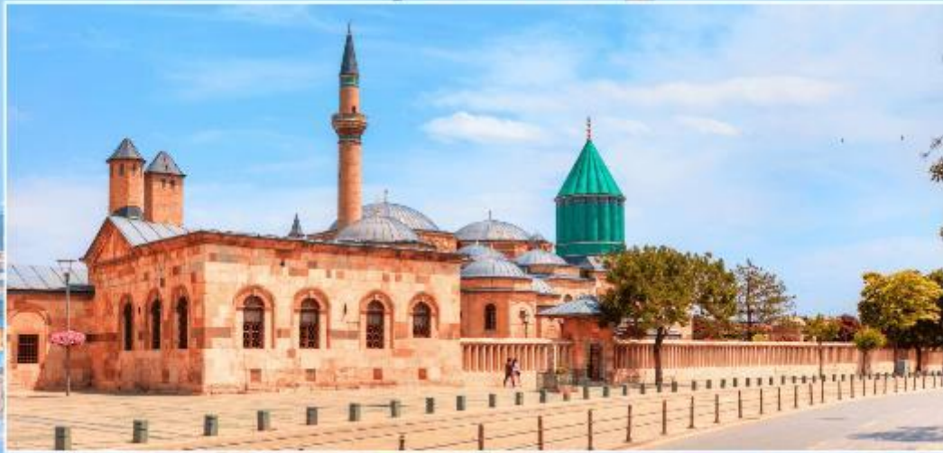
พิพิธภัณฑ์เมฟลานา KONYA

นำท่านเดินทางสู่ เมืองคัปปาโดเกีย (CAPPADOCIA) มาจากภาษาเปอร์เซีย คัตปาตุกา (KATPATUKA) เมืองมหัศจรรย์ที่ได้รับการประกาศจากองค์การยูเนสโกให้เป็นเมืองมรดกโลก เมื่อปี ค.ศ. 1985 เมืองนี้เกิดจากการระเบิดของภูเขาไฟและถูกลาวาปกคลุมหลายพื้นที่ทับถมกันเป็นระยะเวลายาวนานจนกลายเป็นหิน ผ่านลม, ฝน, พายุ ปัจจุบันเกิดเป็นภูมิประเทศที่มีความสวยงามแปลกตาจนกลายเป็นแหล่งท่องเที่ยวที่นิยมสำหรับนักท่องเที่ยวและอีกไฮไลท์ของเมืองนี้คือเป็นจุดขึ้นบอลลูนที่มีวิวสวยงามที่สุด (ใช้เวลาในการเดินทางประมาณ 4 ชม.)