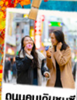
ถนนคนเดินชุนชี่