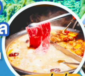
ชาบูหม่าล่า