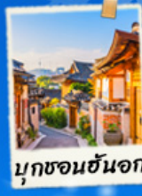
มุกซอนฮันอก