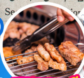
เมนูย่างเกาหลี