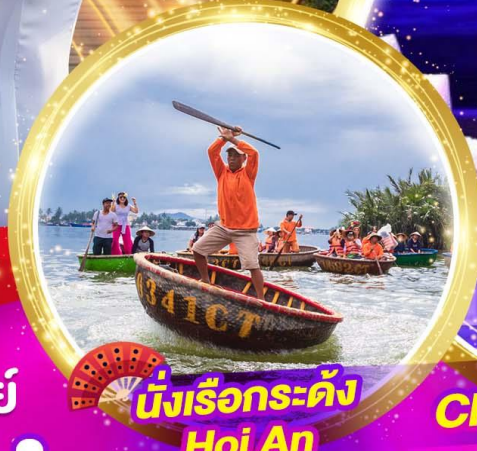
นั่งเรือกระด้ง Hoi An