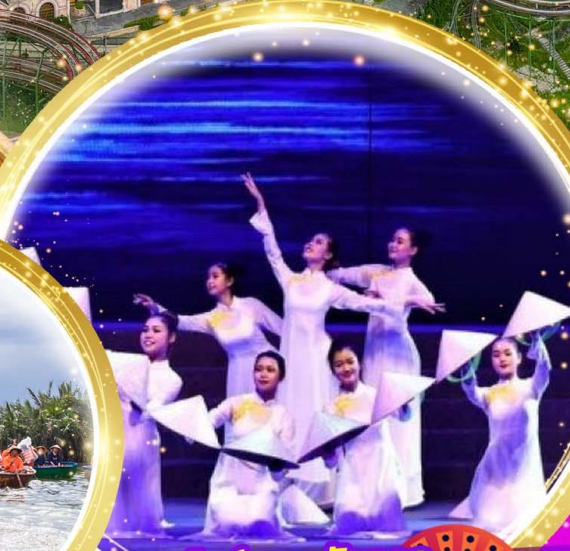
โชว์สุดอลังการ Charming at danang