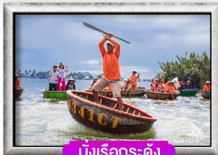
นั่งเรือกระดัง