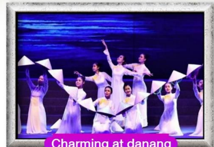
Charming at danang