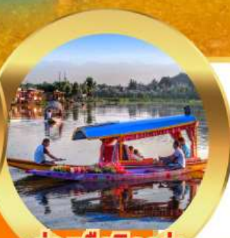
ล่องเรือซิคারা