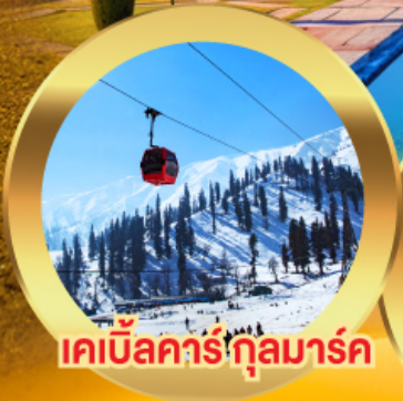
เคเบิลคาร์กุลมาร์ค