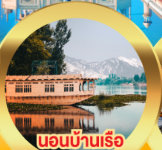
นอนบ้านเรือ วิวเขาหิมาลัย