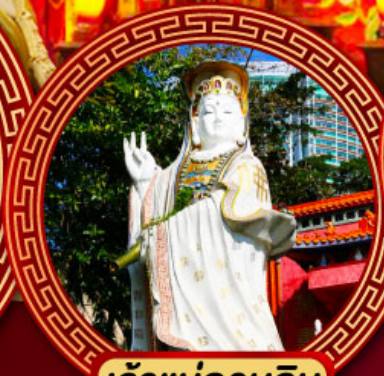
เจ้าแม่กวนอิม รีพัลส์เบย์