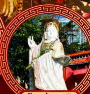
เจ้าแม่กวนอิม รีพัลส์เบย์