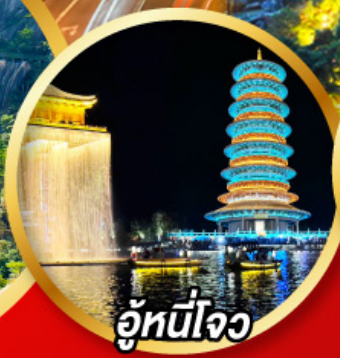
อู่หนี่โจว