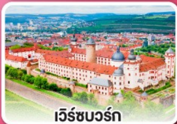
เวิร์ชบวร์ค