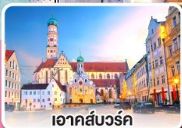
เอาคส์บวร์ค