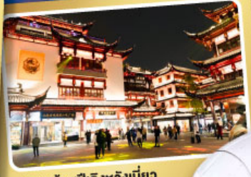
ตลาดร้อยปีเฉิงเหมียว