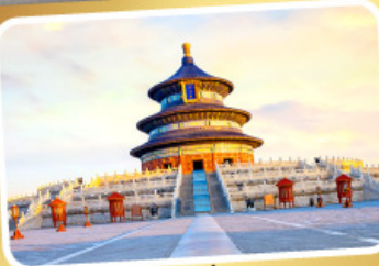
หอฟ้าเทียนถาน