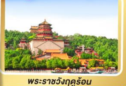
พระราชวังฤดูร้อน