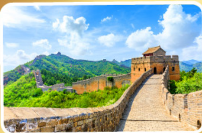
กำแพงเมืองจีน

ต้นตา 2 สวนสนุกระดับโลก Universal Studio Beijing Shanghai Disneyland