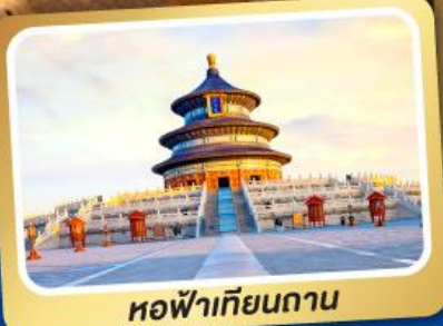
หอฟ้าเทียนถาน