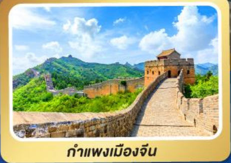
กำแพงเมืองจีน

ตั๋ว 2 สวนสนุกระดับโลก Universal Studio Beijing Shanghai Disneyland