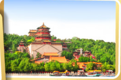
พระราชวังฤดูร้อน