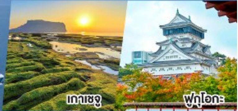
เกาะเชจู