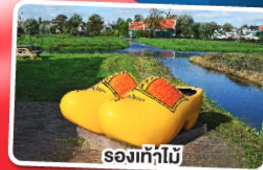
รองเท้าไม้