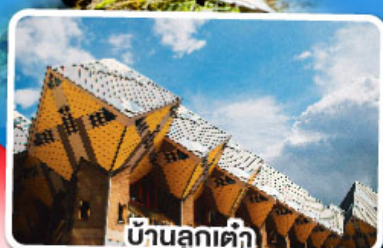
บ้านลูกเต่า