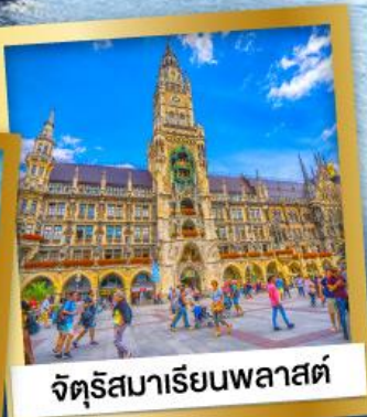
จัตุรัสมาเรียนพลาสต์

28 ธ.ค.67-05 ม.ค.68 95,900 12-20 ก.พ., 12-20 มี.ค.68 89,900