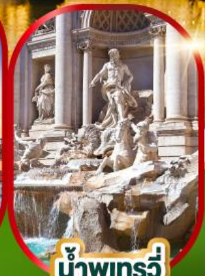
น้ำพุเทรวี่