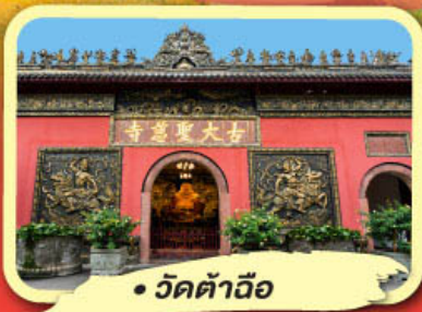
• วัดต้าอิว