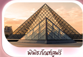
พีพริกันท์ลูฟวร์