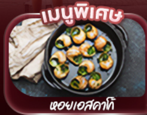
ผองเอสคาท์

“สัมผัสประสบการณ์สุดพิเศษกับแลนด์มาร์คชื่อดังเมืองปารีส” ชมหอไอเฟล ล่องเรือชมวิวปารีสสองฝั่งแม่น้ำแซน ประดูชย์อันยิ่งใหญ่ เยือนพระราชวังแวร์ซายส์ อลังการด้วยสถาปัตยกรรมและสวนอันกว้างใหญ่ พิพิธภัณฑ์ลูฟวร์ ซอปปิงที่ถนนชองเซลีเซ อีสรະเต็มวันสัมผัสบรรยากาศปารีส