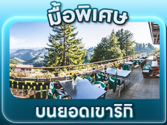
บิวฟิตซ์