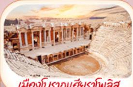
เมืองโบราณเฮียราโพลิส