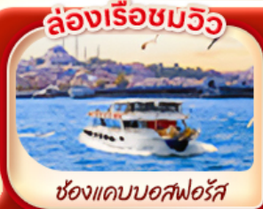
ล่องเรือชมวิว