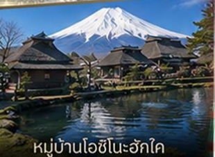
หมู่บ้านโอชิโนะฮักโค