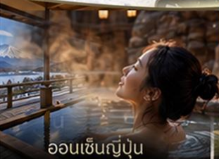
ออนเซ็นญี่ปุ่น