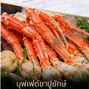
บุฟเฟต์ซาปูยักซ์