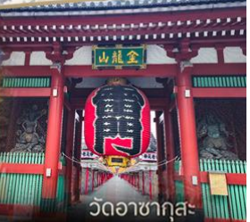
วัดวอดาซากุสะ