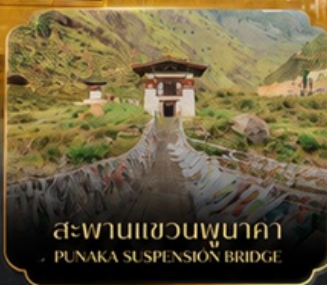
สะพานแขวนพุนาคา PUNAKA SUSPENSION BRIDGE