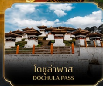
โดชูล่าพาส DOCHULA PASS