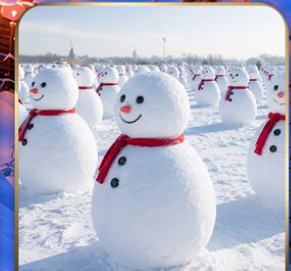
สวนตุ๊กตาหิมะ