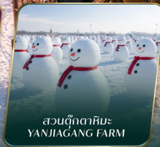
สวนตุ๊กตาหิมะ YANJIANG FARM