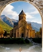
มัทสเคต้า UNESCO HERITAGE