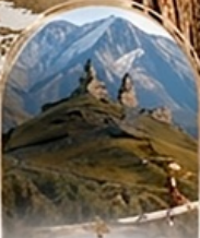
คาสเบกี 4WD EXPERIENCE