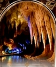
ดำโพรมิริอูล BOAT RIDE

เดินทางช่วงปีใหม่ 27 ธ.ค. - 3 ม.ค. 70 ราคาเพียง 75,989 บาท / ท่าน