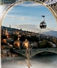
ทบิลีซี OLD TOWN