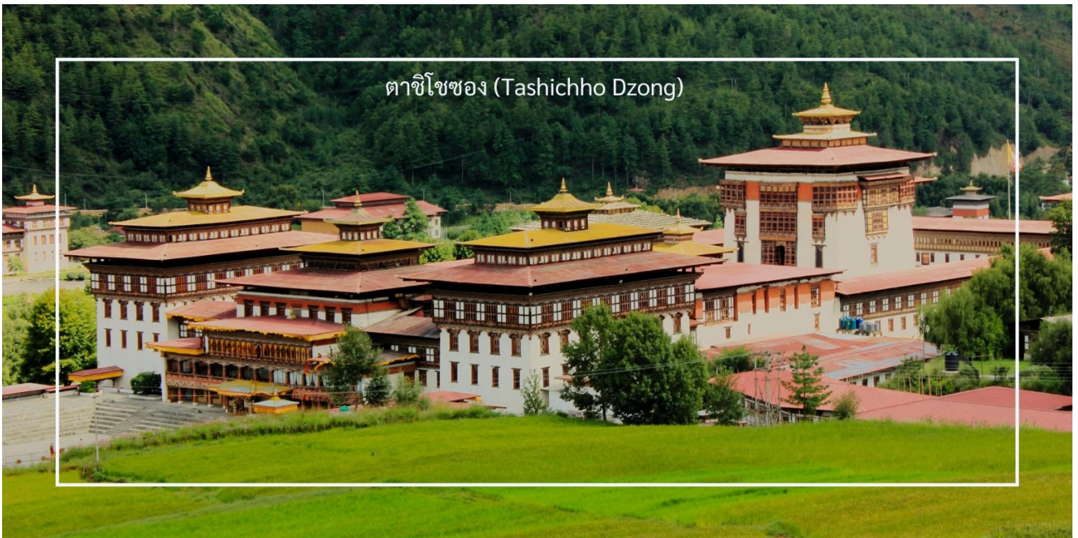
ตาชิโซของ (Tashichho Dzong)

เที่ยวชม ตาชิโซของ (Tashichho Dzong) เป็นป้อมปราการและวัดที่สำคัญในเมืองทิมพู (Thimphu) ประเทศภูฏาน โดยตั้งอยู่ริมแม่น้ำและมีวิวทิวทัศน์ที่สวยงามของเมืองและภูเขา มีการออกแบบในสไตล์ภูฏานดั้งเดิมที่งดงาม ประกอบด้วย การใช้ไม้และหินในการสร้าง ซึ่งแสดงถึงความสามารถทางศิลปะและวัฒนธรรมของภูฏาน ตาชิโซของเป็นที่ทำการของ รัฐบาลและเป็นที่ตั้งของสำนักงานของพระมหากษัตริย์แห่งภูฏาน รวมถึงยังมีการจัดการประชุมสำคัญต่างๆ ภายในตาชิโซของยังมีพระอุโบสถและวัดที่ใช้ในการประกอบพิธีกรรมทางศาสนา ซึ่งเป็นสถานที่ที่สำคัญสำหรับพระสงฆ์และประชาชน