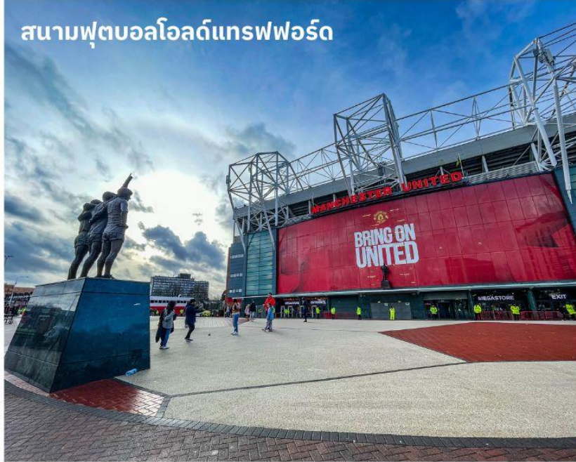
สนามฟุตบอลโอลด์แทรฟฟอร์ด

จากนั้นนำท่านเดินทางสู่ เมืองแมนเชสเตอร์ ใช้เวลาเดินทางประมาณ 1 ชั่วโมง เป็นอีกหนึ่งเมืองท่าที่สำคัญของประเทศอังกฤษและยังเป็นเมืองที่มีประชากรมากที่สุดเป็นอันดับสองของประเทศอังกฤษ รองจากมหานครลอนดอน จากนั้นนำท่านถ่ายรูปด้านหน้า สนามฟุตบอลโอลด์แทรฟฟอร์ด แห่งทีมแมนเชสเตอร์ ยูไนเต็ด สโมสรฟุตบอลชื่อดังโลกที่มีสมาชิกแฟนคลับมากที่สุดในโลก เจ้าของสมญานาม “ปีศาจแดง” สนามเริ่มก่อสร้างในปี 1909 และเริ่มใช้ตั้งแต่วันที่ 1910 ปัจจุบันมีความจุ 76,212 คน