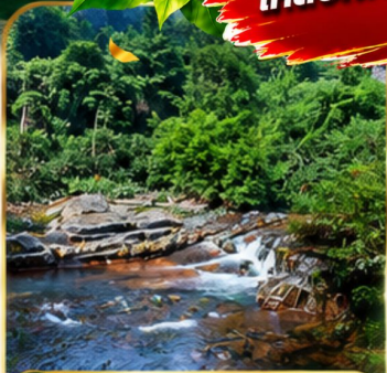
อุทยานพงเลี่ยนซี