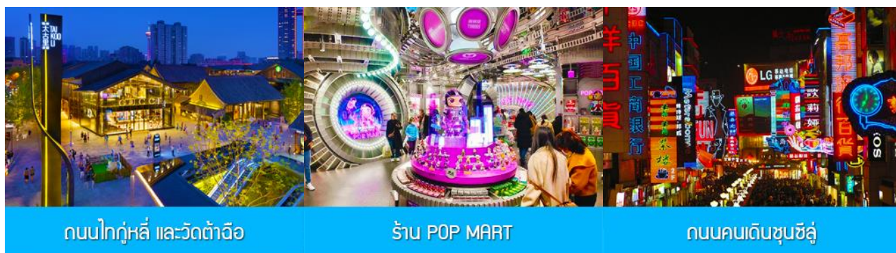
ถนนไท่กู่หลี่ และวัดต้าฉือ

พักที่ โรงแรม SERENGETI HOTEL ระดับ4 ดาวห้องถื่นหรือเทียบเท่า